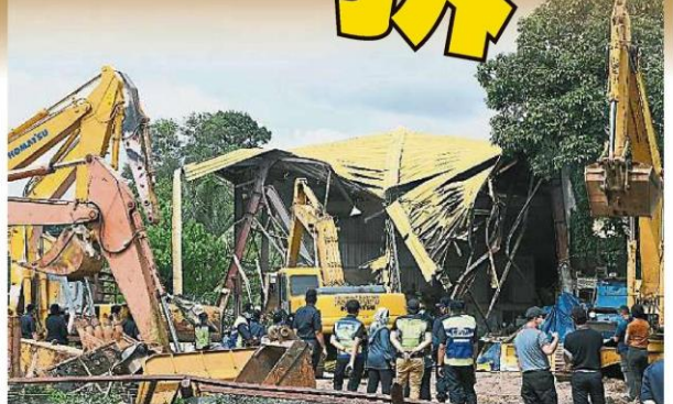
停放重型机械和用具的工厂被拆。

“万挠在过去至少有2厂涉及污染贡河, 引发大断水, 所以我们如今绝不留情, 这8家被点名拆迁的工厂必须马上停业, 若阳奉阴违继续暗中操作会被控上庭。”