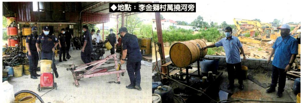
◆地點：李金獅村萬撈河旁