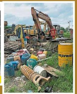
1. 非法重型机械维修厂沿河而建, 并未遵守与万挠河保留至少25呎距离的规定。