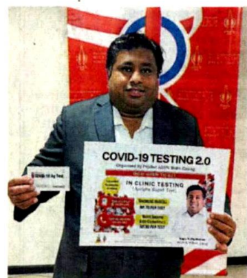
剂盒，进行冠病检测。 合，让民众仅需70令吉即可买到检测试剂盒，拉吉夫服务中心再与2所私人诊所配

拉吉夫呼吁卫生部提供民众，以更实惠的价格进行快速抗原检测试剂盒检测，也促请卫生部关注乡区社群可获得检测的便利。