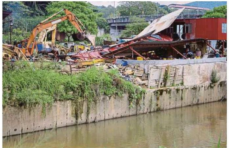
Operasi merobohkan bengkel dan stor haram menyimpan jentera berat dijalankan anggota MPS di Kampung Dato Lee Kim Sai, Rawang, semalam.

Pada 8 September lalu, Sultan Selangor, Sultan Sharafuddin Idris Shah, menitahkan tindakan