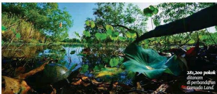
281,200 pokok ditanam di perbandaran Gamuda Land.