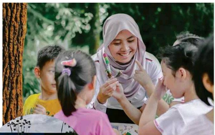
2,218 kanak-kanak direkrut sebagai renjer Gparks.

"PERHILITAN, kerajaan Selangor dan Gamuda Land membaiki pulih, menambah baik serta mempertingkatkan kemudahan dan aktiviti sambil mengekalkan sifat rustic atau kedesaan di ka-