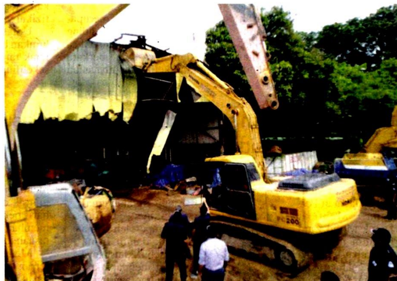
Operasi merobohkan bengkel jentera berat di Kampung Dato Lee Kim Sai semalam.

RAWANG - Dua daripada lapan struktur haram yang terletak di pinggir Sungai Rawang di Kampung Dato Lee Kim Sai di sini dirobohkan dalam operasi penguatkuasaan yang dijalankan semalam.