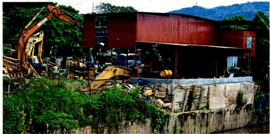
Torn down: MPS enforcement officers demolishing an illegal factory operating along Sungai Rawang in Kampung Dato Lee Kim Sai, Selangor.