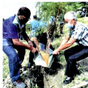
GOTONG-royong FoR dan komuniti setempat membersihkan kawasan Sungai Klang sempena sambutan Hari Sungai Sedunia.