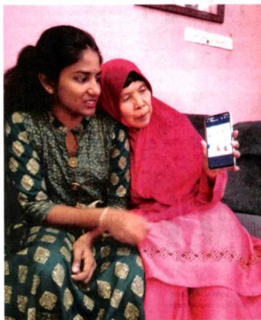
SAMA (kanan) menunjukkan gambar perkahwinan cucunya kepada Indhu.

"Saya juga turut menasihatkan anak-anak biarpun berbeza agama, setiap orang apatah lagi jika lebih tua daripada kita perlu dihormati termasuk pembantu rumah," katanya.