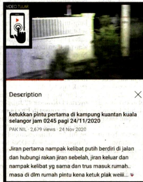
Tular di platform YouTube seorang jiran ternampak kelibat lembaga berpakaian putih di Kampung Kuantan, Kuala Selangor semalam.