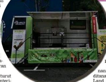
Inisiatif Gamuda Parks termasuk pengurusan sisa makanan.