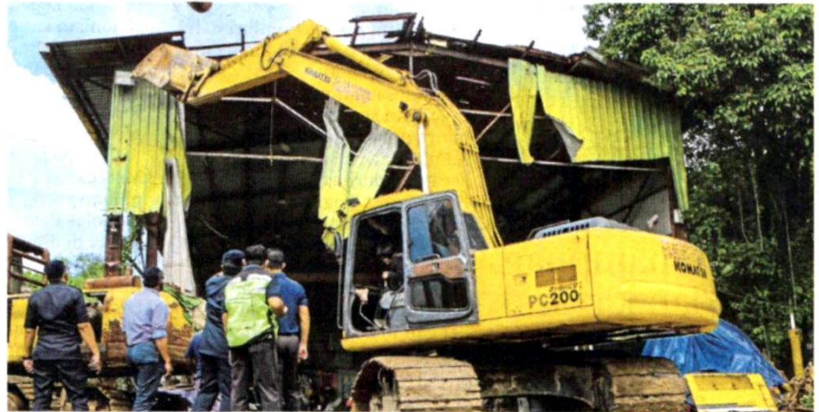
KERJA merobohkan dua kilang jentera berat haram dijalankan MPS di Kampung Dato Lee Kim Sai, Rawang, semalam.