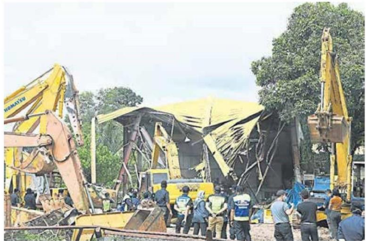
■停放重型机械和用具的工厂被拆。

清洁剂和机械黑油，且未依据环境局的标准排污，一旦下大雨污物会流入河中，引发断水危机。”