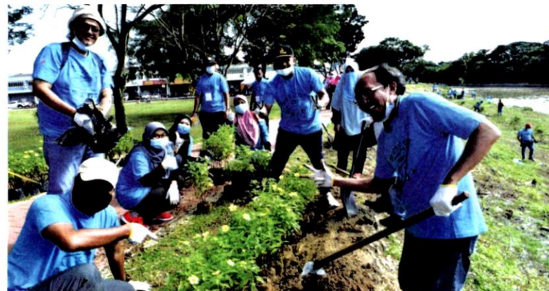
KOMUNITI setempat turut turun padang menanam pokok di persisiran Sungai Klang.

mantau secara mudah kualiti air sungai di kawasan mereka," katanya ketika berucap merasmikan majlis sambutan Hari Sungai Sedunia peringkat Selangor di Subang Jaya.