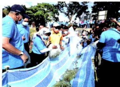
ANAK ikan dilepaskan ke dalam sungai ketika aktiviti gotong-royong FoR sempena Hari Sungai Sedunia.