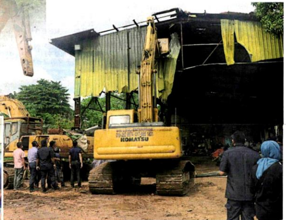
■其中一間非法工廠遭當局拆除，部分機械也被充公。